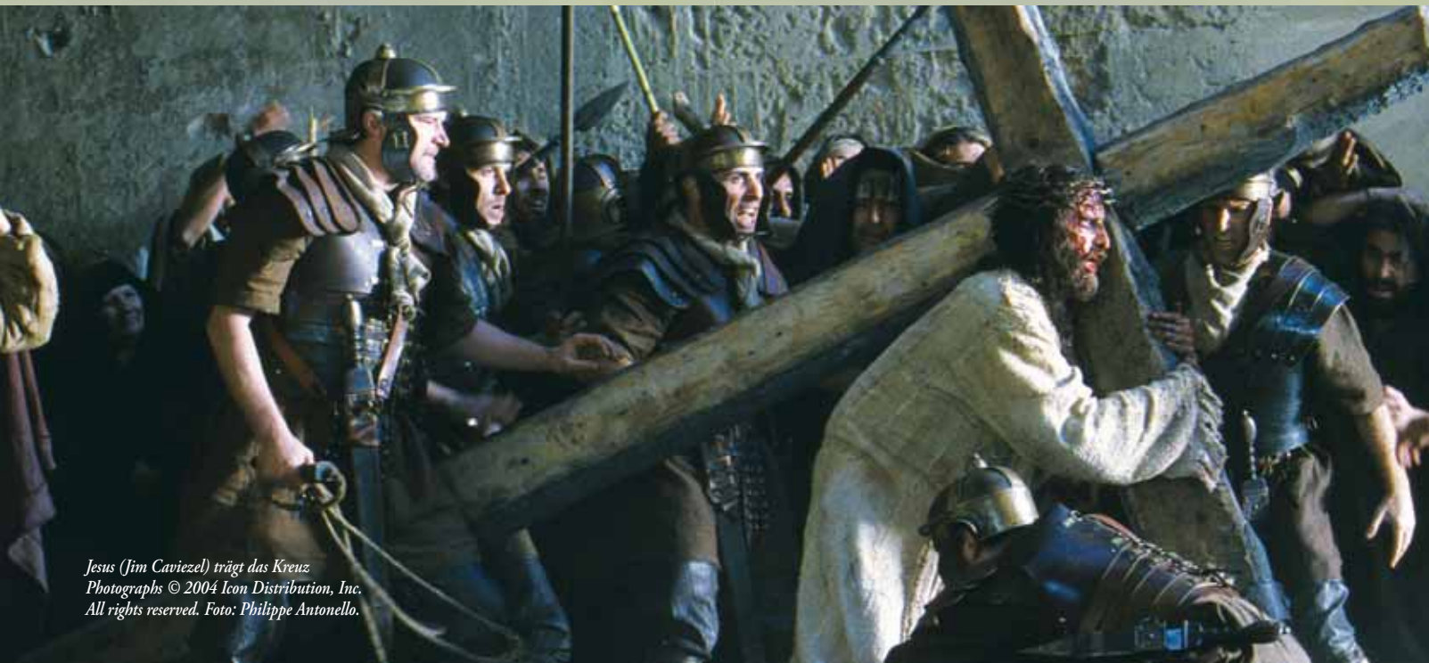
Jesus (Jim Caviezel) trägt das Kreuz

Ihr Glaube an Christus ist der Schlüssel zur Erlösung.